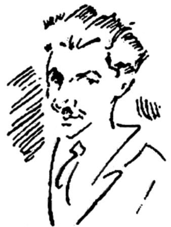
چهره صادق هدایت، اثر سورویوگین

صادق هدایت در سال ۱۲۸۰ ه. ش. در یک خانواده اشراف از دودمان رضا قلی خان هدایت در تبریز به دنیا آمد. و رهنوی مصلاخ اعزاز به فرانسه رفت و در سال ۱۳۰۹ به ایران بازگشت. ابتدا به استخدام بانک ملر در آمد و در این ایام، «گروه ربع» را شکل گرفت که عبارت بودند از «بزرگ علوی، مسعود فرزاد، مجتبی مینوس و صادق هدایت». و در سفر به هندوستان، زبان پهلوسرا فراگرفت و رمان معروف «بوف کور» را در آنج دیار منتشر کرد. و چندین بار شغل خود را عوض کرد. سرانجام در سال ۱۳۳۰ در پاریس بازن کرد. خودکشی